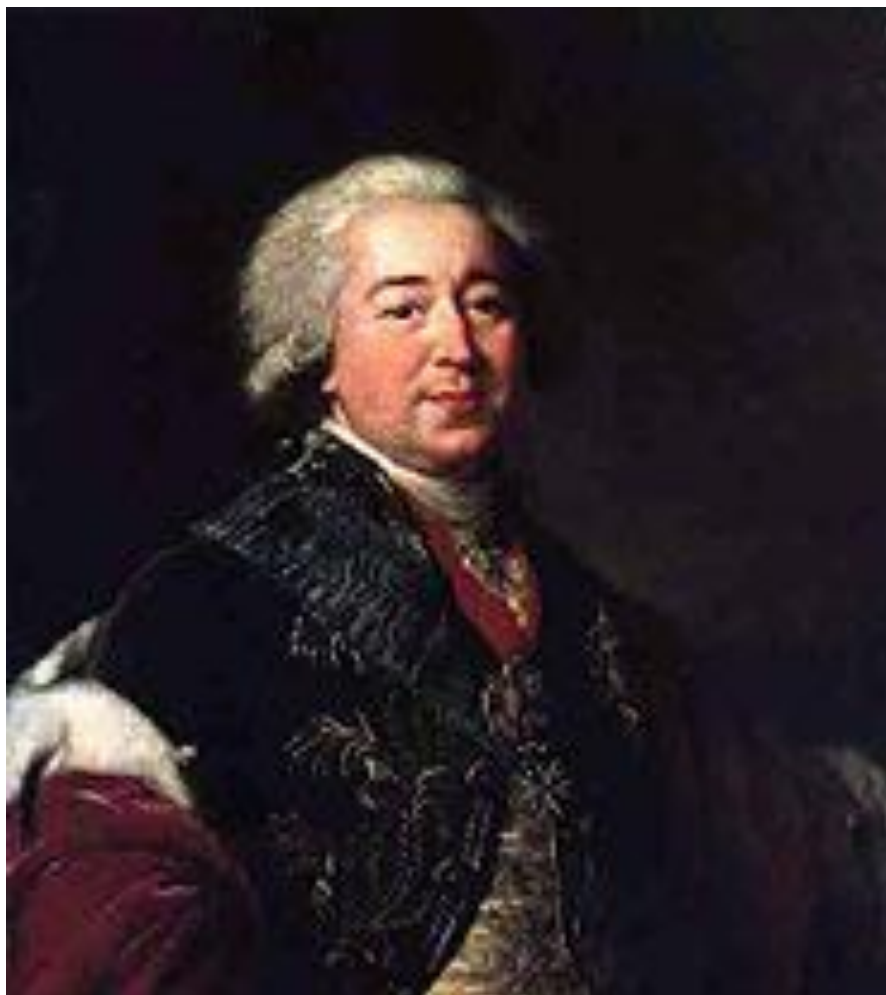
2. Александр Борисович Куракин (1752-1818). Портрет работы Элизабет Луизы Виже-Лебрен.