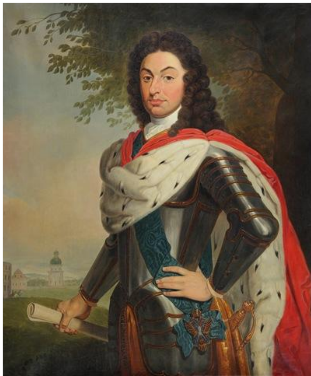
1. Князь Борис Иванович Куракин (1676—1727)