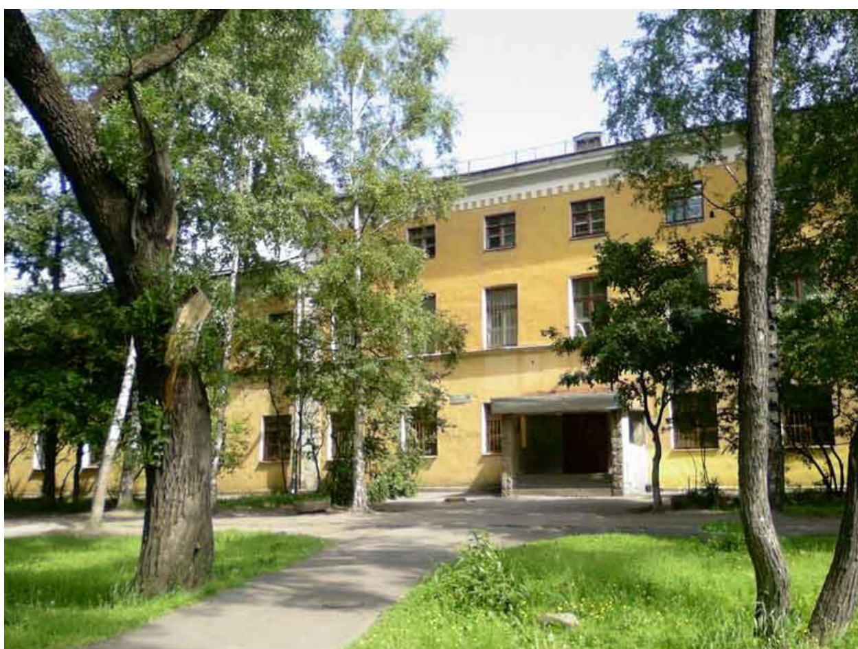
7. Куракина Дача. Средняя общеобразовательная школа № 328 с углубленным изучением английского языка.