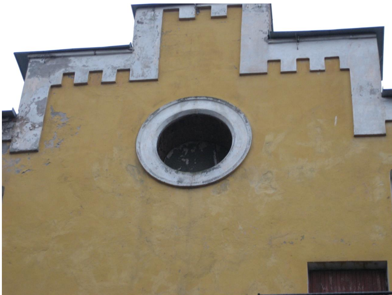
8. Куракина Дача. Здание бывшей Школьной Церкви ансамбля.