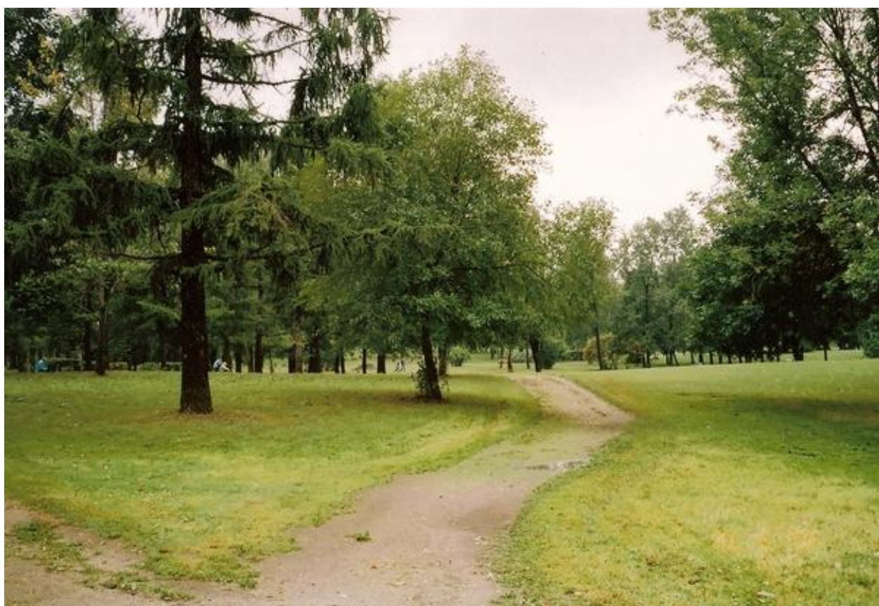
4. Парк «Куракина Дача».