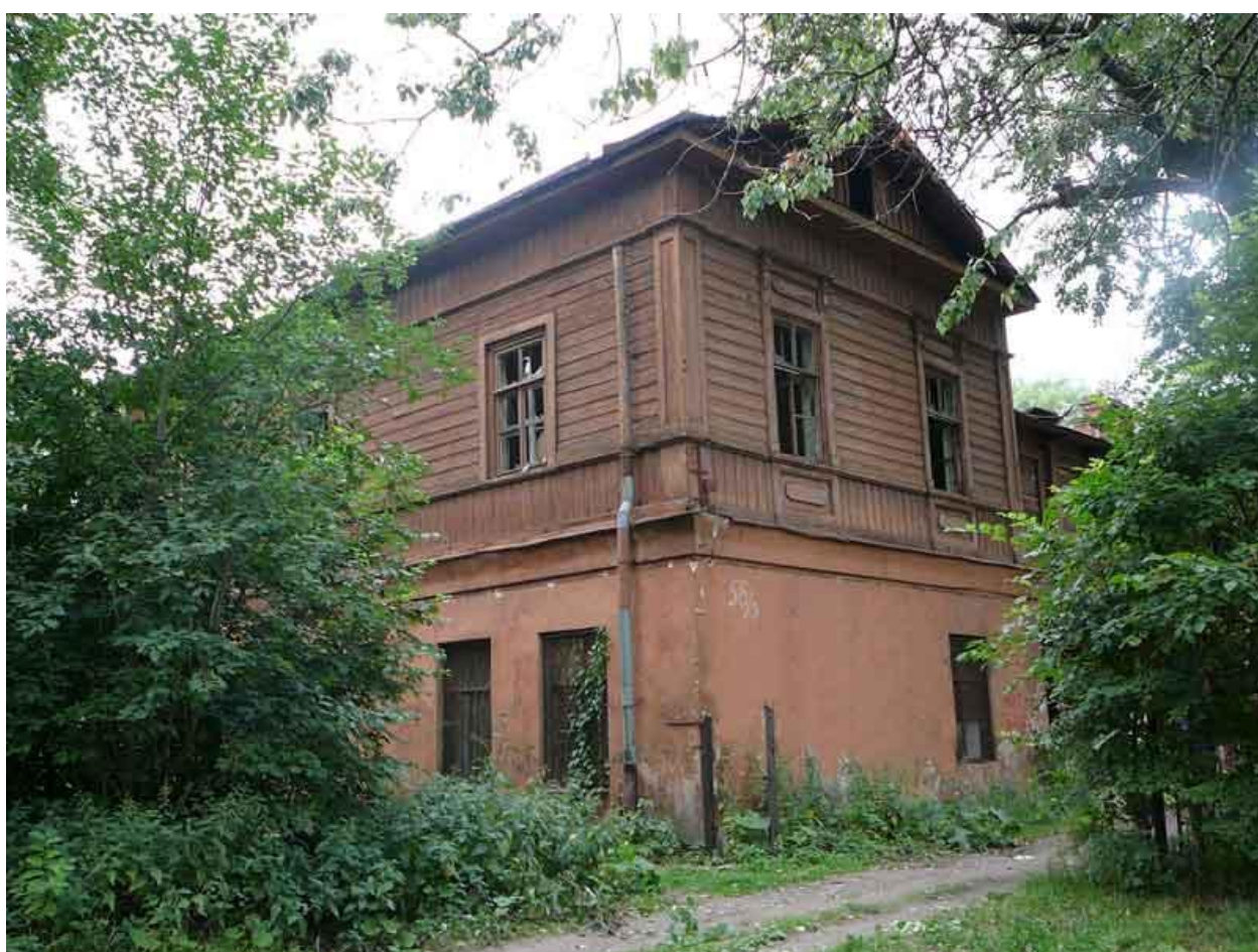
6. Куракина Дача. Бывшее здание лазарета.