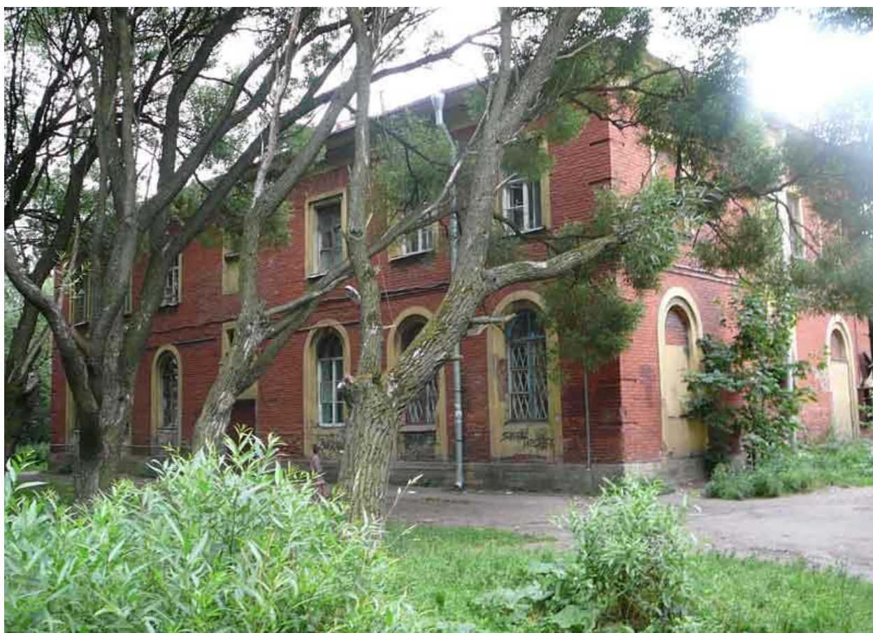
5. Куракина Дача. Бывшее здание преподавательского корпуса.